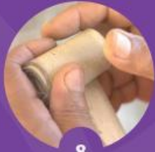
8 นำใบลานแห้งมาบ้วน