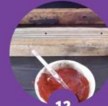
12 ตัดปะกัต (ตีเส้นบรรทัดด้วยไม้ปะกัต)