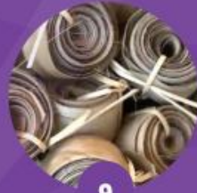
9 มัดเก็บไว้เพื่อเตรียมใช้งาน