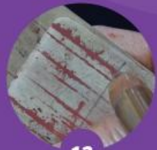
13 จาร (เขียน) ด้วยเหล็กปลายแหลม