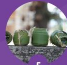
5 มัดใบลานเพื่อเตรียมนำไปต้ม