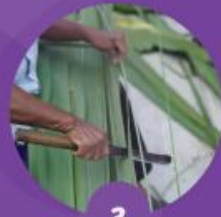
3 ตัดแต่งใบลาน