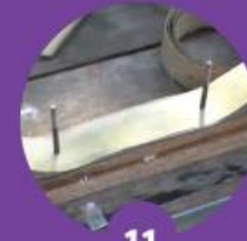
11 เจาะรูร้อยใบลาน