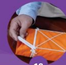
18 มัดด้วยสายสนอง (สายสยอง)