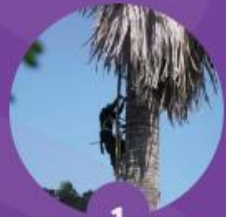
1 ตัดใบลานจากต้นลาน