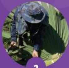
2 แยกใบลานออกจากก้าน