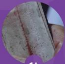
14 อักษรที่จารจะปรากฏเป็นร่องลึก