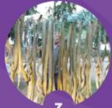
7 ตากใบลานให้แห้ง