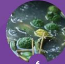
6 ต้มใบลาน