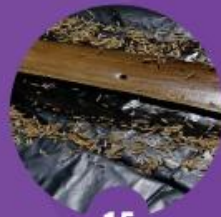
15 นำขี้เถ้าหรือเขม่ามาทาแล้วลูบด้วยแกลบ