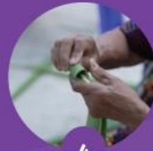
4 นำใบลานมาบ้วน