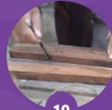
10 นำใบลานมาต้มให้เหนียวก่อนใช้งาน