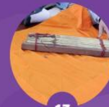
17 เตรียมผ้าห่อคัมภีร์ใบลาน